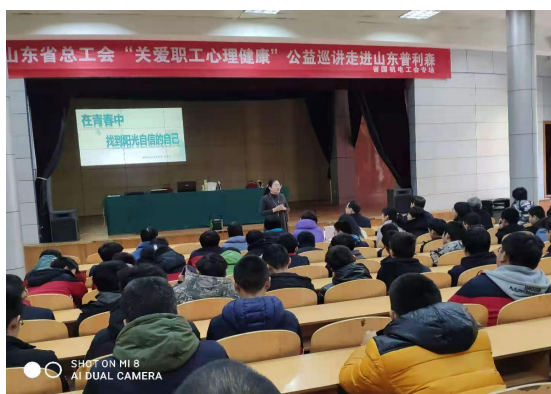
图 1-5 开展心理健康教育