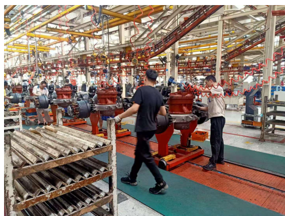
机械专业学生实习基地