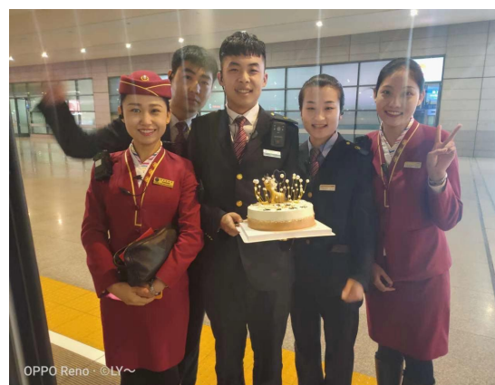
高铁乘务专业学生实习基地