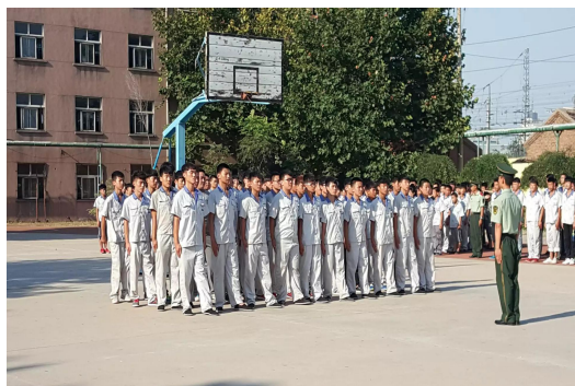
图 1-1 新生军训