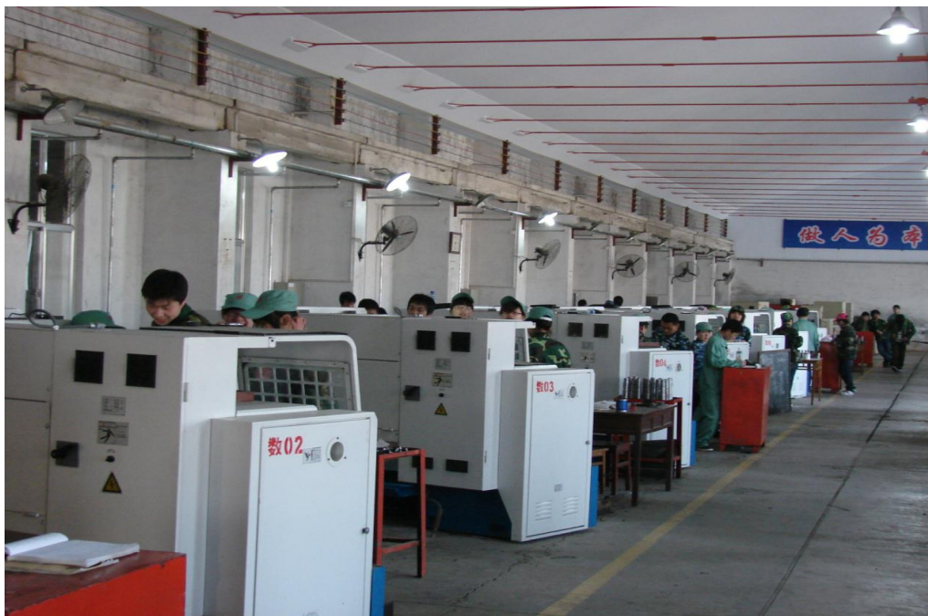
数控技术应用专业实习车间

学校图书馆藏书丰富，今年新增图书 5000 册，现纸质图书达到 34550 册。图书馆坚持每周开放 4 天，满足学生阅览要求，确保图书较高的流通率。