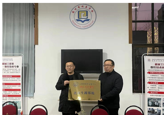
被评为“优质生源地”

同时我校是企业办学，拥有雄厚的实训条件，“做中学、做中教”的教育特色显著，多年来，一直使用边理论边实践的“双元制”教学法。工学结合、顶岗实习管理制度严格并有效实施。每期顶岗实习安排6个月的时间，派驻专门教师全程跟踪指导与管理实习学生，实行校企共同管理。