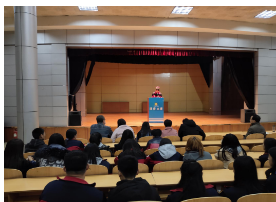
图 1-6 “我和我的祖国”演讲比赛