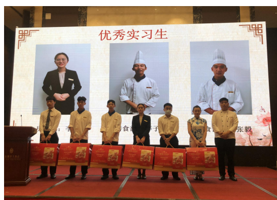
烹饪专业学生校外实习