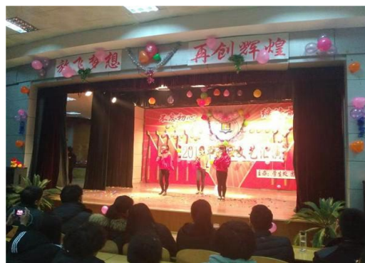
图 2-6 文艺汇演