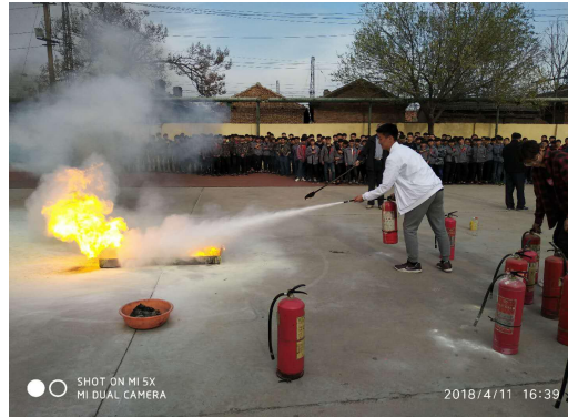
图 2-4 防火演练