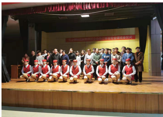
高铁班学生毕业典礼