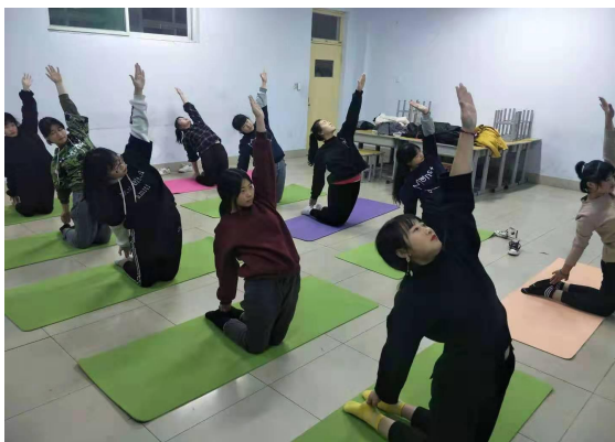
图 2-7 瑜伽培训班