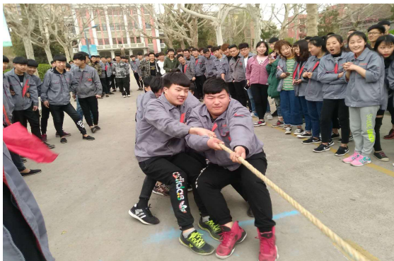
图 2-5 拔河比赛