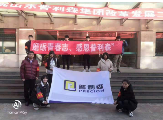
图 2-10 参加社会实践活动