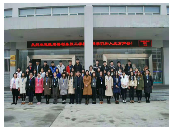
学生在实习单位合影留念