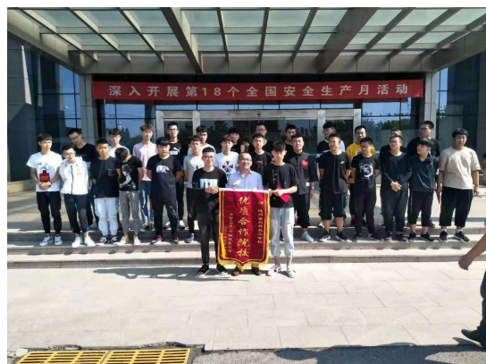
“优质合作院校” 领奖现场