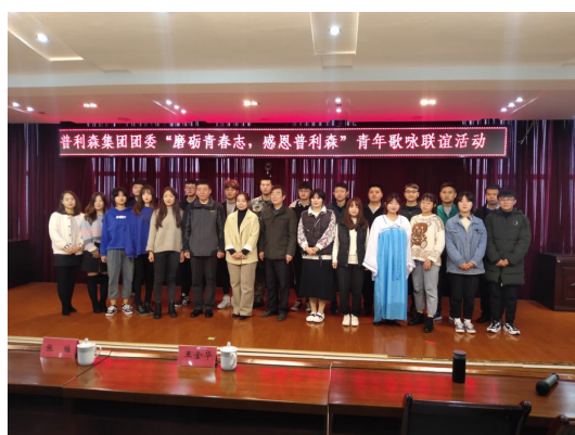
图 2-8 参加集团团委活动