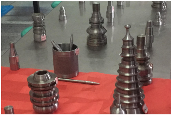
图 2-3 学生作品