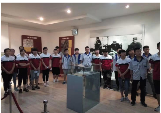
图 2-9 进行爱国主义教育