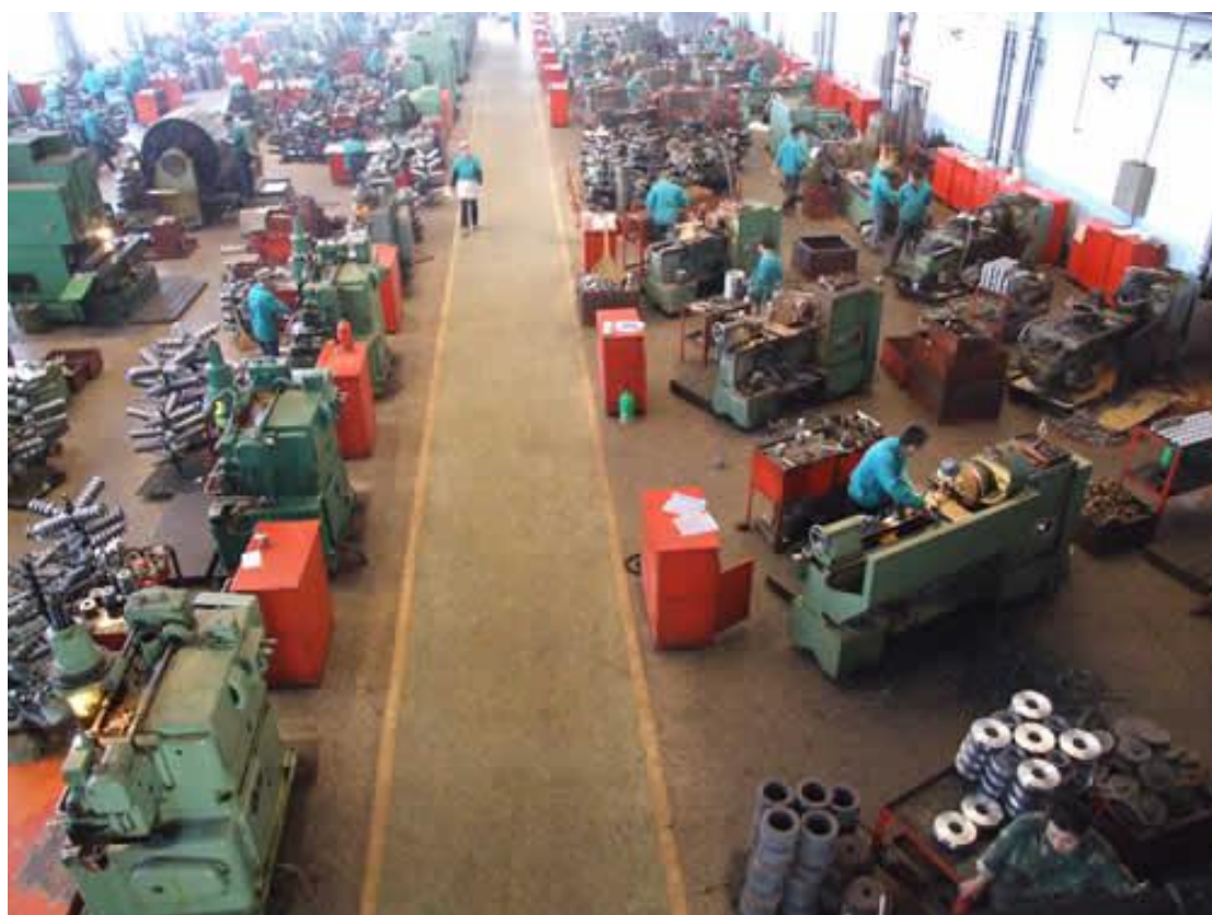
数控技术应用专业实习车间