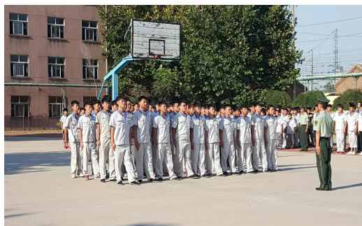
图 2-2 新生军训