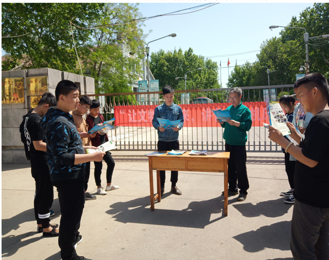
积极开展“职业教育活动周”相关活动