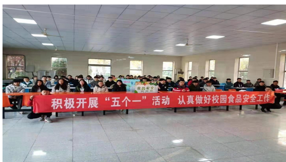
图 2-1 强抓校园食品安全

学校自然环境优雅美观，学习生活设施齐全，教师综合素质优良，实习实训设备精良，安全管理网络健全，校园文化氛围浓郁。从激发学生学习兴趣、增强学生学习信心、构建多样化课余文化生活等方面来丰富学生的学习生活体验。通过问卷调查显示，学生理论学习满意度 93.6%，专业学习满意度 98.9%，实习实训满意度 97.6%，校园文化满意度 93.7%，社团活动满意度 96.1%，校园安全满意度 97.7%，毕业生对学校满意度达到 98.2%。