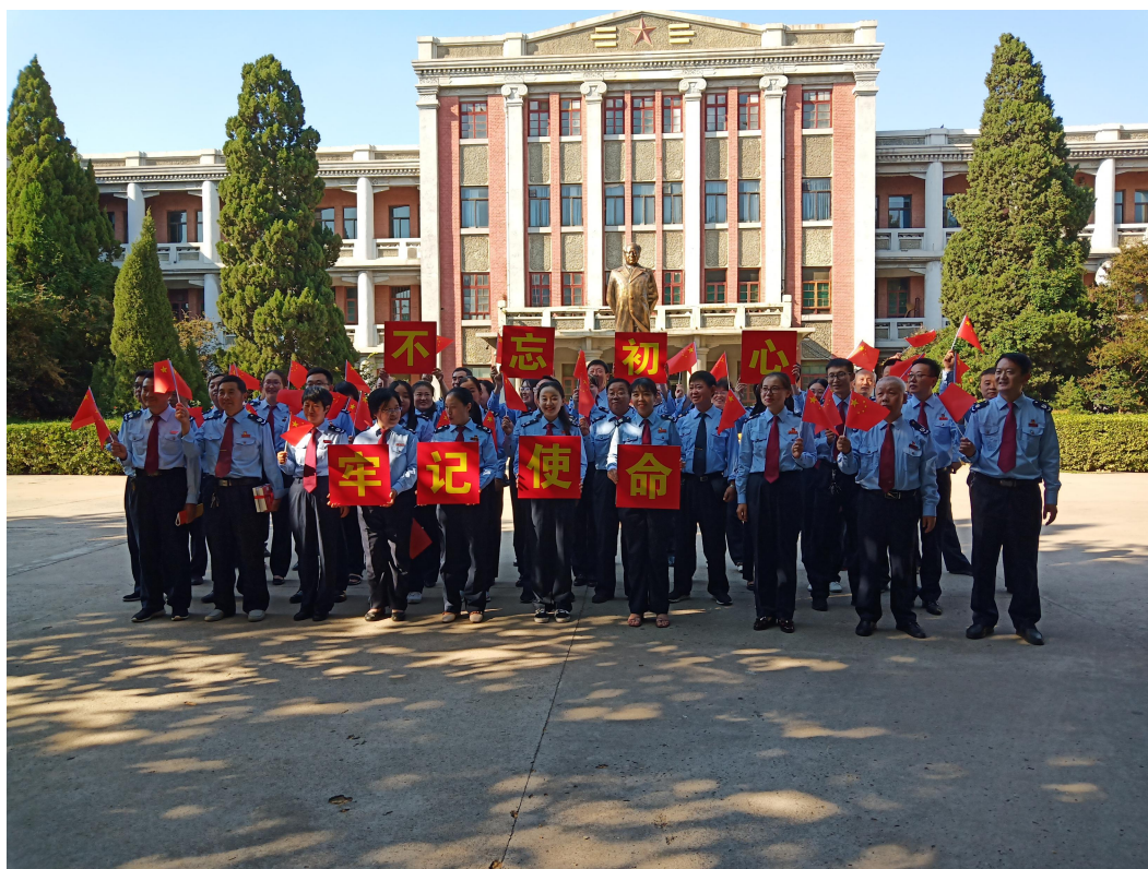
德州市税务局和运河区税务分局全体党员以及入党积极分子 60 余人开展“我爱你中国”和“以红色基地为讲堂现场党课，不忘初心重温入党誓词”等系列活动

3、为进一步提升全省博物馆的社会教育功能，发挥典型案例的示范引领作用，2019 年山东省文物局委托山东省博物馆学会开展了“全省博物馆十佳优秀社会教育活动案例”评选活动。德州普利森机床博物馆报送的《孩子们永恒的红色第二课堂》喜获“全省博物馆优秀社会教育案例”，受到省文物局的通报表彰，并获赠荣誉奖牌。