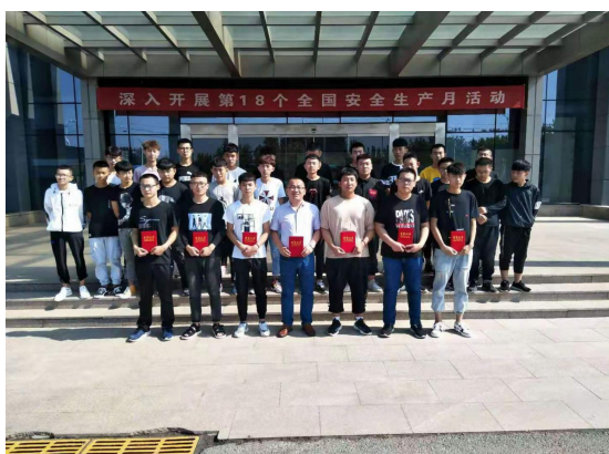
受表彰优秀实习学生合影