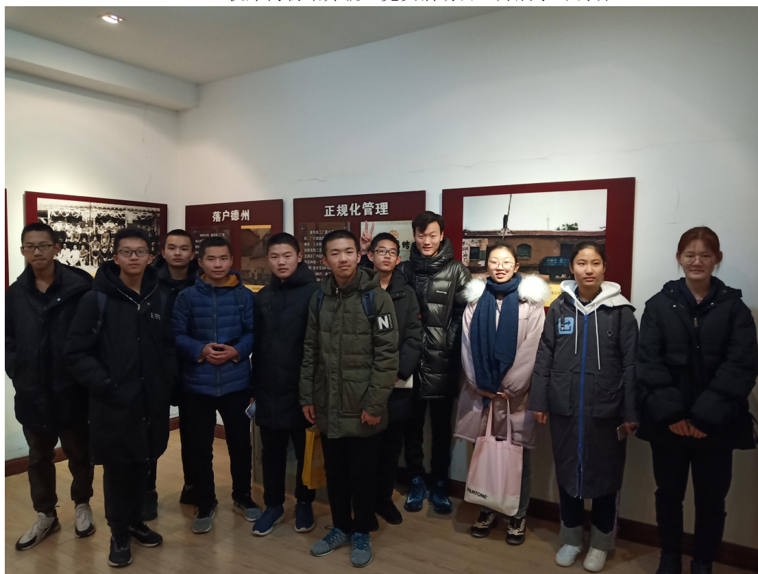
积极开展中学生社会实践活动